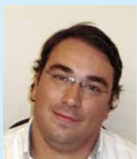
Pedro Rodrigues Presidente da JSD